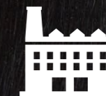
Fremstilles under GMP-kontrollerede forhold

BOVIKALC® FREMSTILLES UNDER KONTROLLERERE FORHOLD, SÅ DU FÅR SAMME KVALITET HVER GANG DU KØBER BOVIKALC®